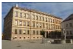
Václavské nám. 8

Základní škola, Znojmo, Václavské nám. 8, 669 42 Znojmo příspěvková organizace