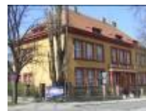
Jubilejní park 23